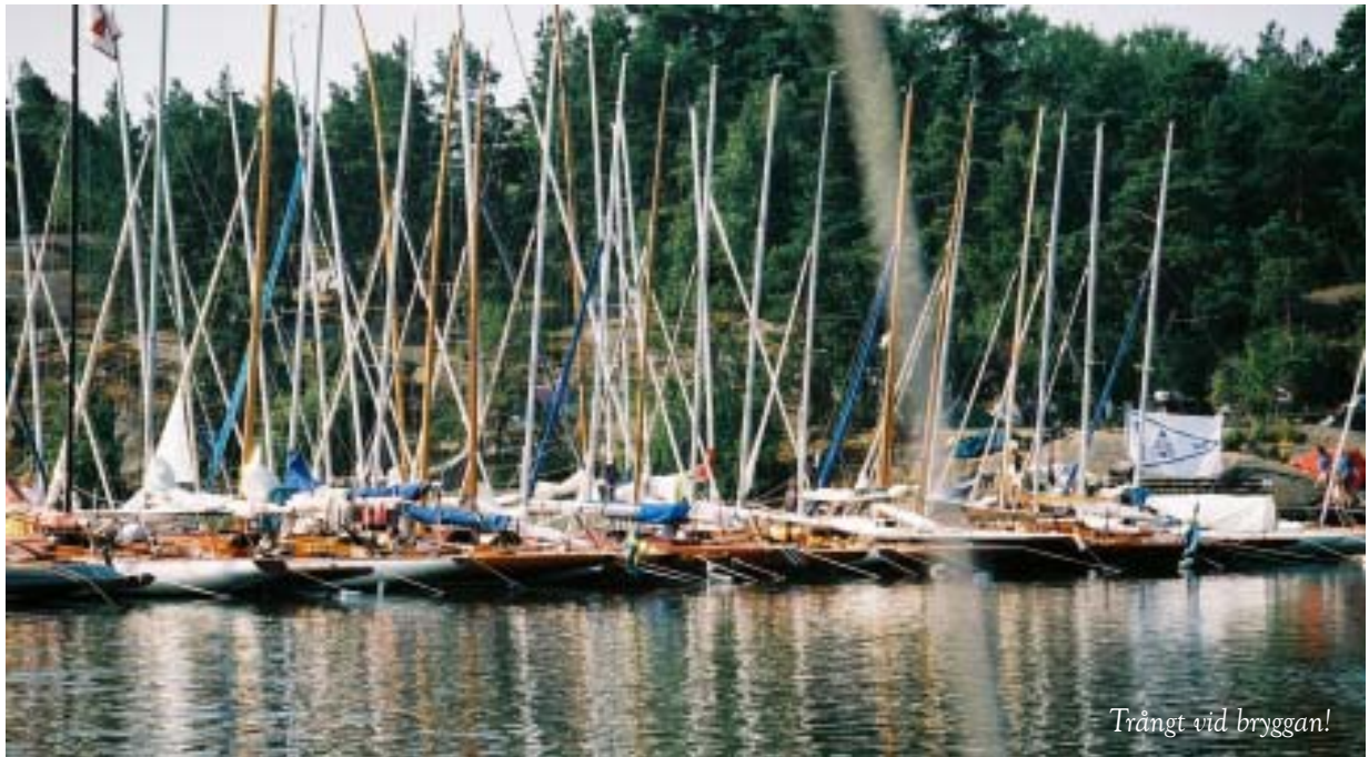
Trångt vid bryggan!

Det var hett på linjen varje dag med flera omstarter. Tricksonita vann efter åtta delseglingar med totalt 18p, Amorita hade 22p och trean Juana 23p. Ticksonitas framgångar var särskilt glädjande eftersom besättningen var debutanter i A22. Det visar på att det finns en förnygring i klassen som annars samlar många grå gentlemän.