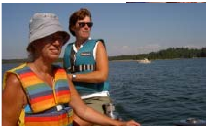
Glada och engagerade deltagare i seglarkurserna