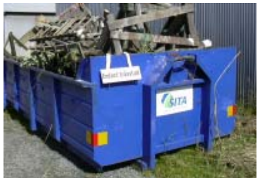
Sophantering - ett minne blott!