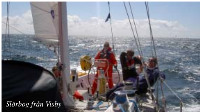
Slörbog från Visby

Starten ut till Almagrundet var en styrbordbog i 5-7 m/s S-SSO. Ner mot Gunnarstenarna utanför Nynäshamn vred vinden mot SV. Tyvärr "tågade" de övriga "Swanarna" ifrån oss, då vi ej fick till båtfarten. Nästa rundning låg vid Salvorev, mellan Gotska Sandön och Färö. Det medförde en behaglig sträckbog för styrbord under kvällen och natten. Jag stod själv vid ratten när vi rundade Salvorev, där vi lovade söderut. Via VHF kunde konstateras att vi tappat ytterligare på de övriga Swan 65:orna.