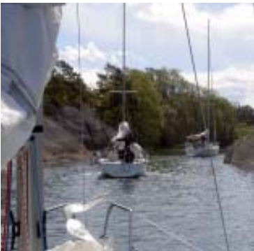
T.v. På väg ut till etapp 3, från Lökholmen.

Avslutningsetappen blev den tuffaste. Med 12-14 m/s NV, regn och ca 8 grader startade vi med två rev i storen och mellan- genua. Bansträckningen med