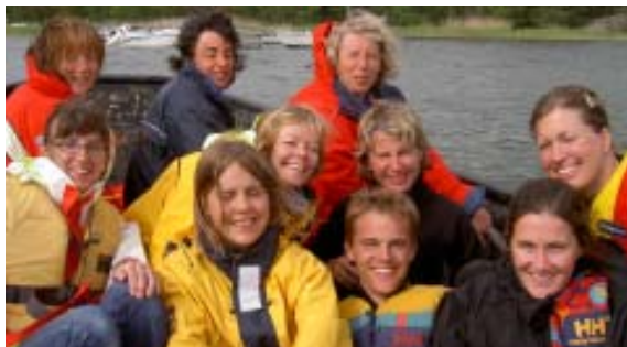
Ovan: Nöjda deltagare på seglarskolan i Juni. Nedan t.v. Seglarlägret och t.h. praktiska tillämpningar på augustikursen.

Det är naturligtvis glädjande att se en trygg återväxt och inte minst att kurserna för damer samlar så många deltagare som bygger på ett självständigare båtintresse! Med all tydlighet har deltagarna haft kul!