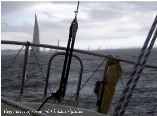
Regn- och hagelskur på Gråskärsfjärden