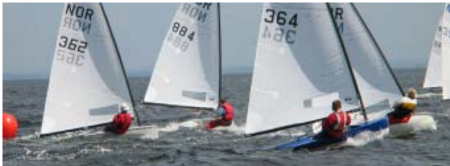
En färfyllad bild lånad från E-jolleseglingar i Norge. Nog ser det inspirerande ut!