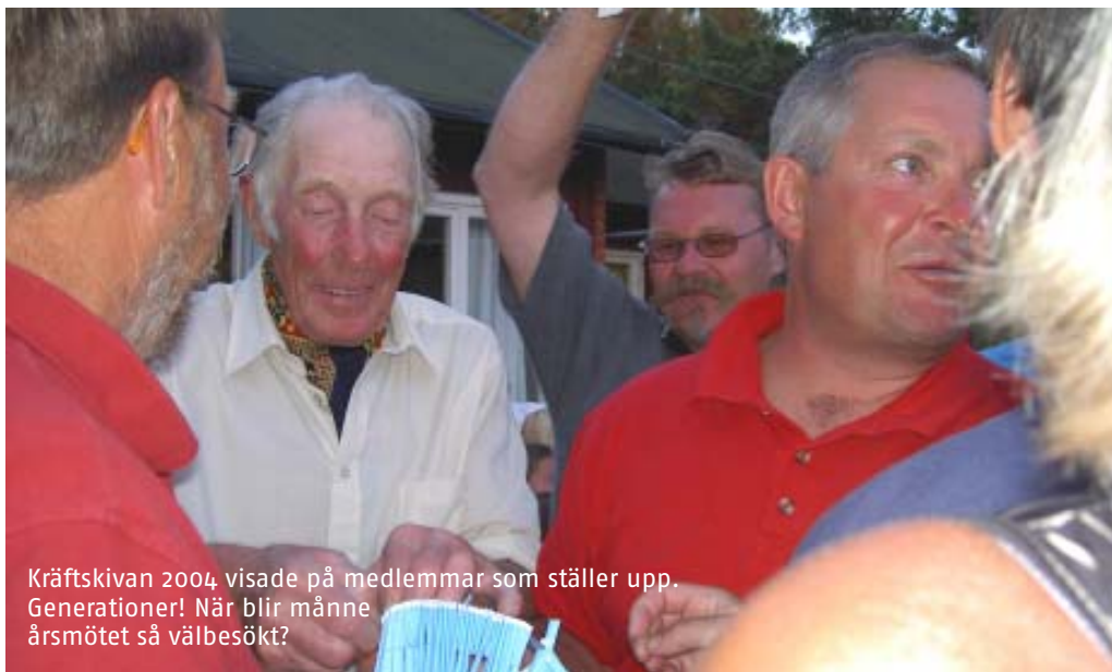
Kräftskivan 2004 visade på medlemmar som ställer upp. Generationer! När blir männe årsmötet så välbesökt?

Årsmötet gick av stapeln på jollebasen, Brandholmen, i ett snöfritt decembermörker. Det var, om inte välbesökt så dock trettioalet medlemmar som hörsammat kallelsen och infunnit sig. Så långt räckte också stolarna. Vi kanske ska göra som bilhandlarna och locka med glass och ballonger till barnen...? Nåväl, kaffet, lussebullarna och pepparkakorna smakade utmärkt!