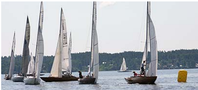
Det kan vara tätt då det seglas! Pokalsegling 2003